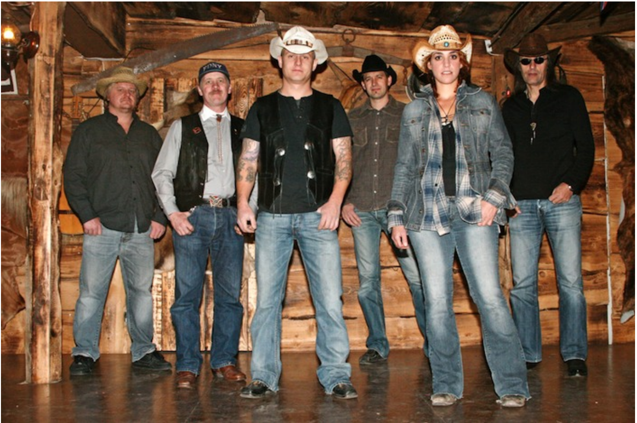
Der traditionelle Schweizer Act kommt in diesem Jahr aus dem angrenzenden Fürstentum Liechtenstein: die Two Rocks Band.